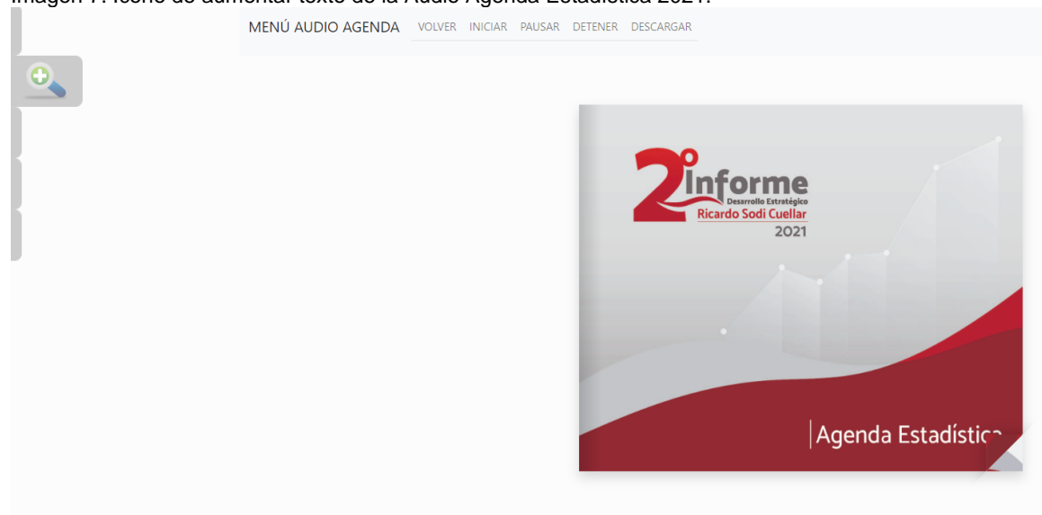
Imagen 7. Icono de aumentar texto de la Audio Agenda Estadística 2021.

Y al dar click en disminuir texto podrá hacer más pequeño el contenido.