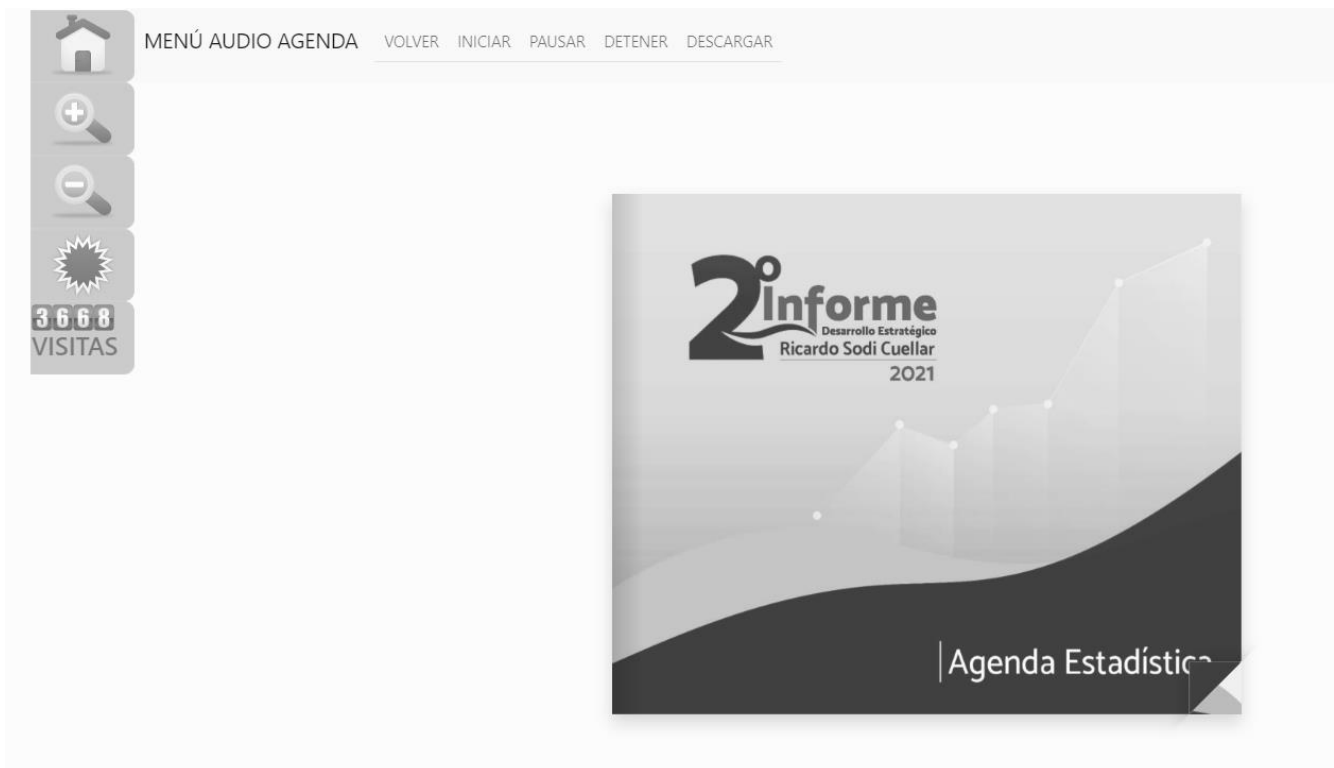
Imagen 9. Información en escala de grises

Al dar click en el icono de escala de grises todos los componentes de la pantalla aparecerán en una tonalidad gris.