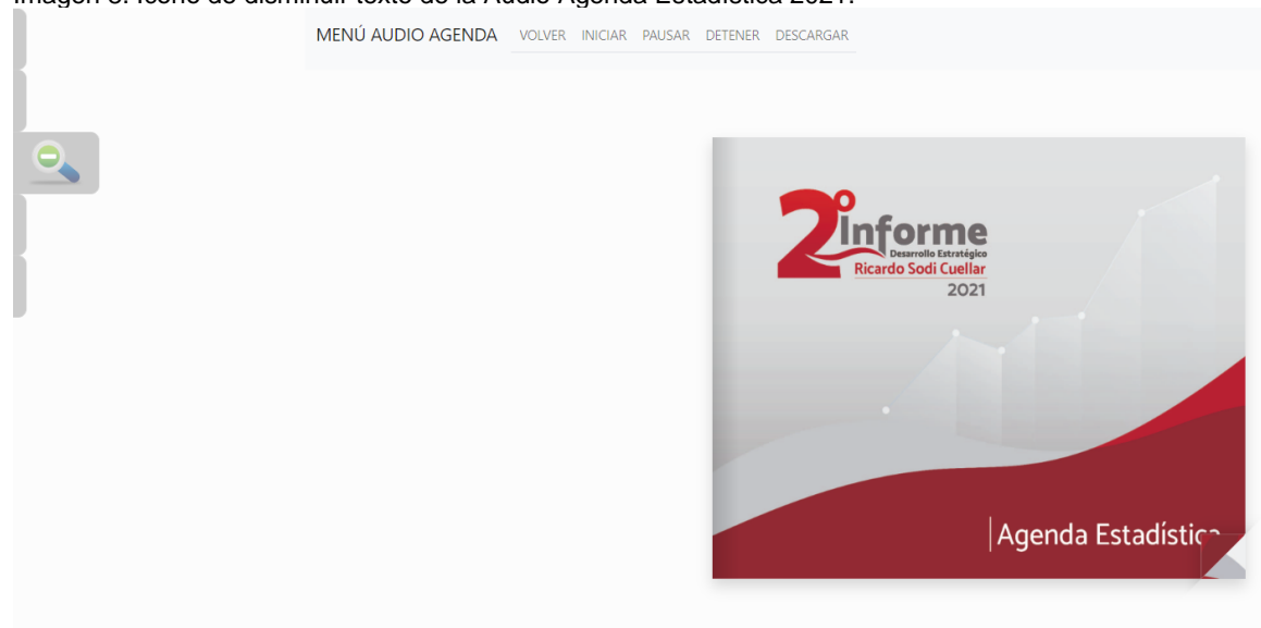
Imagen 8. Icono de disminuir texto de la Audio Agenda Estadística 2021.

Y al dar click en disminuir texto podrá hacer más pequeño el contenido.