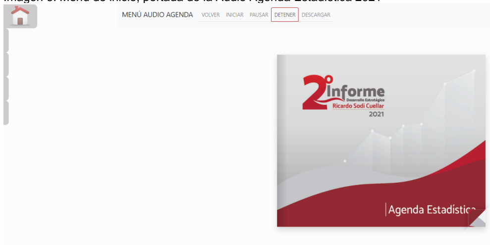
Imagen 6. Menú de inicio, portada de la Audio Agenda Estadística 2021

Al dar clic en la opción de Inicio regresará a la portada de la Audio Agenda Estadística 2021.