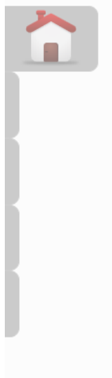
Imagen 5. Menú lado izquierdo, primer icono (inicio).

Del lado izquierdo de la página se encuentra otro menú como las opciones; inicio, aumentar o disminuir texto, escala de grises y así como el número de visitas que ha tenido la página.